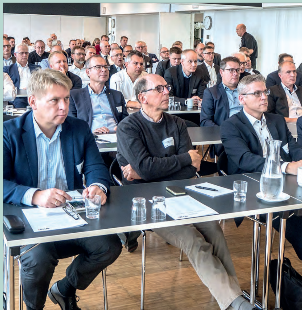
De fremmødte har traditionelt stort udbytte af BITVAdøgnet 24h-arrangementet, hvor der både er førende indlægsholdere og rig tid til at netværke medlemsvirksomhederne imellem.

Menuen på BITVAs årlige netværksdøgn er således stærkt, fagligt